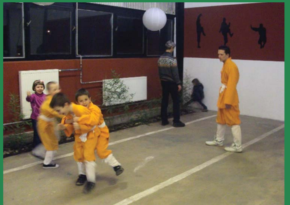
Apró kung-fu harcosok