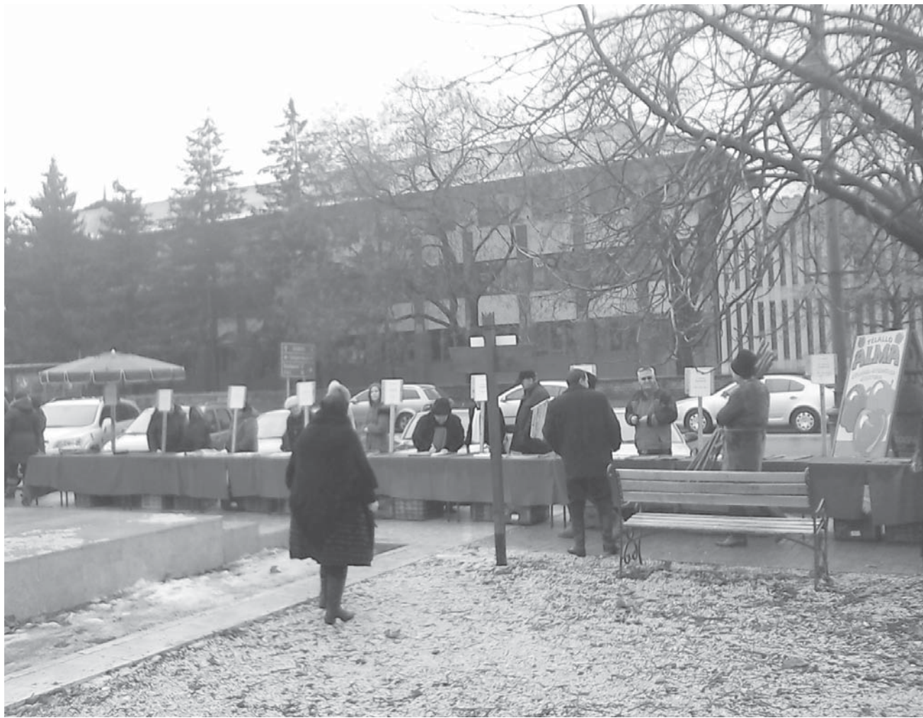
Virágos, tiszta porta 2012 díjak átadása

Az önkéntesekből álló bíráló bizottság május és szeptember között értékelte a porták rendezettségét, a díjak átadására december 16-án a betlehemi jászol megnyitása kapcsán került sor a Fő út mentén. A díj az erkölcsi elismerésen kívül egy képzőművészeti alkotást is jelent, amit a „Virágos, tiszta porta 2012” cím birtokosai felerősíthetnek a kerítésre, kapura, házfalra is.