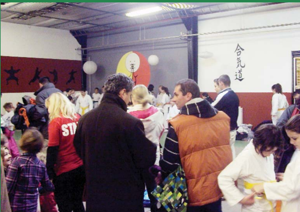
Szülők, sportolók, érdeklődők

A megnyitó záró akkordjaként stílusosan harcművészeti bemutatót láthatott a szép számban megjelent vendégsereg.