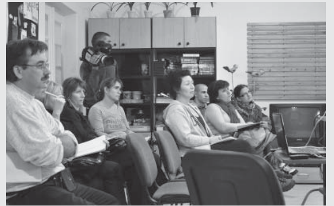
Tájékoztató a lehetőségekről

A munka elvégzése után ún. YouthPass-t kaphat-