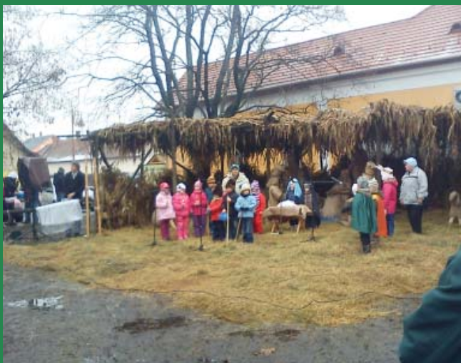
Ovisok betlehemes játéka