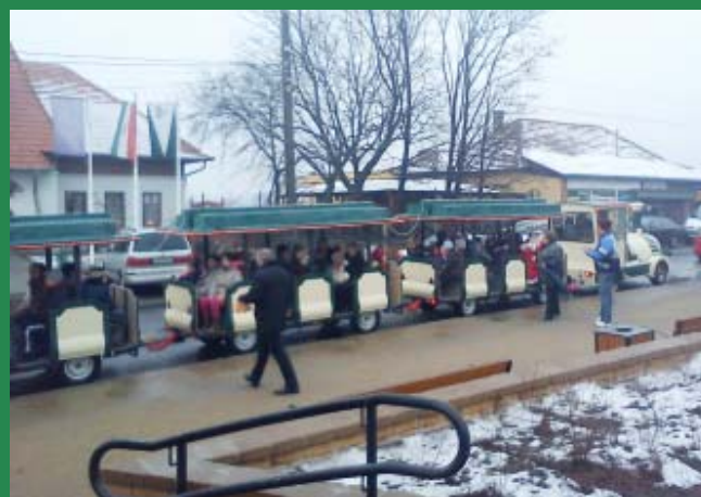
Erdőkertesen a kisvonat volt a legnépszerűbb a Betlehem nyitó rendezvényén