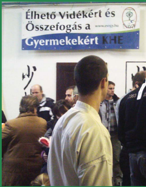
Ez a kezdeményezés is az ÉVÖGY nevéhez fűződik