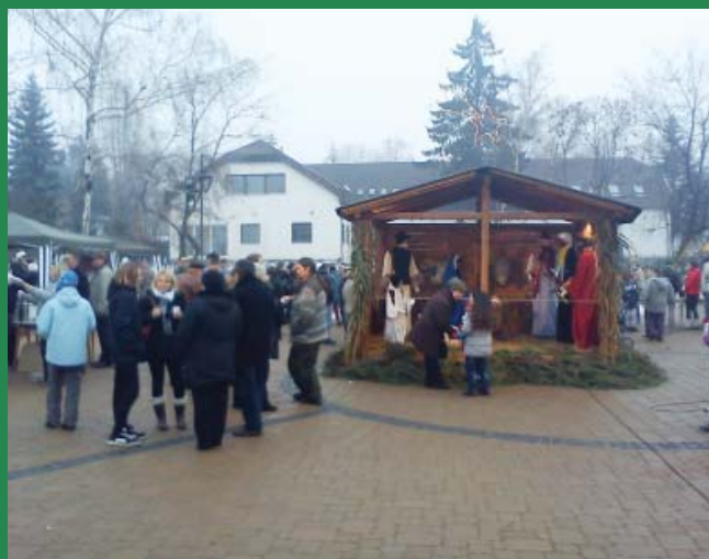
Kicsik és nagyok is kíváncsiak voltak a Betlehemre