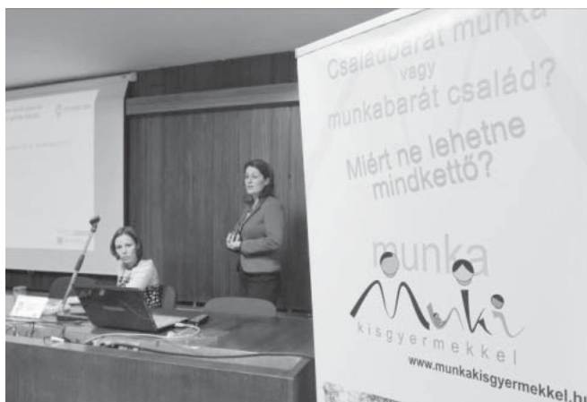
Pódiumbeszélgetés a MuKi szakmai kerekasztalán

Minden bejelentő személy anonimitása garantált, minden bejelentést kivizsgálunk.