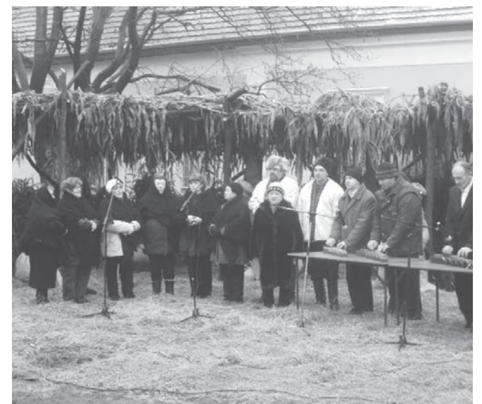
A Veresi Népdalkör műsora

Erdőkertesen is elfoglalta méltó helyét a községi parkban a település betlehemje, amelyet tavaly készítettek el, a helyiek kezdeményezésére és közreműködésével. A legnagyobb attrakció a Veresegyházról érkezett kisvonat volt, amellyel mindenki tehetett egy kört a park körül. A rendezvényen jótékonysági vásár is volt, ahol az óvodások kézműves munkáit lehetett megvásárolni.