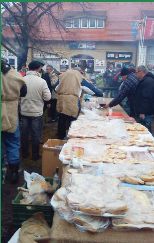
Kelendő volt a zsíroskenyér